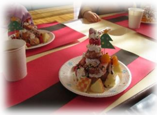
クリスマスツリーケーキ