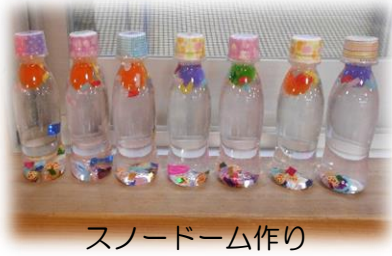
スノードーム作り